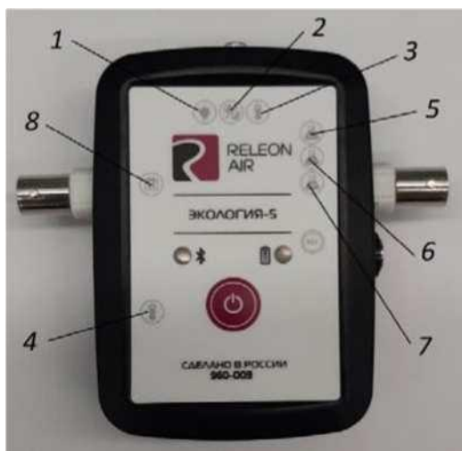
Рис. 2. Мультидатчик по экологии. Обозначение разъёмов и технологических отверстий: 1 — освещённость, 2 — относительная влажность воздуха, 3 — температура окружающей среды, 4 — температура растворов, 5 — нитрат-ионы, 6 — хлорид-ионы, 7 — рН,

Мультидатчик по экологии позволяет измерять следующие показатели: водородный показатель водных сред, концентрации нитрат-ионов и хлорид-ионов, электропроводность, влажность, освещённость, температуру окружающей среды, температуру растворов, растворов и твёрдых тел (рис. 2).