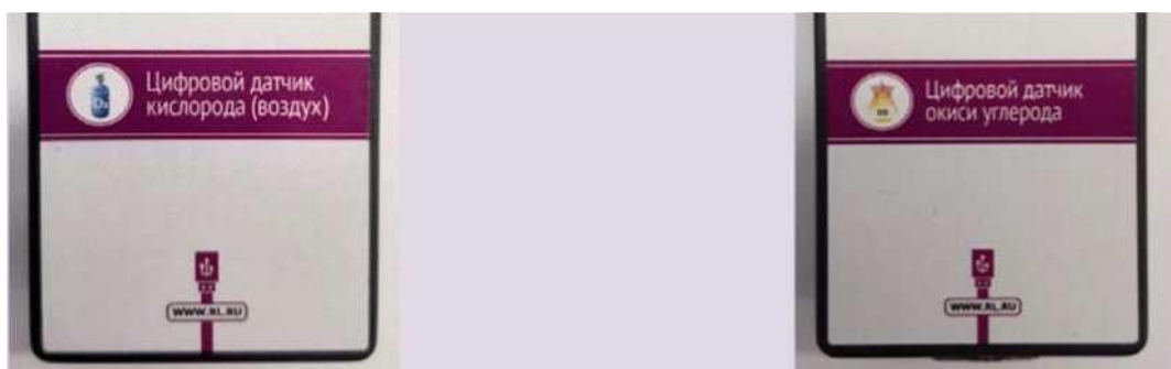
Рис. 11. Датчики кислорода (слева) и угарного газа (справа)

Датчик окиси углерода — измеряет концентрацию монооксида углерода (угарного газа) в окружающей среде. Диапазон измерения: от 0 до 1000 ppm (миллионные доли). Разрешение датчика: 1 ppm. Технологические особенности: при учёте в исследовании ещё и содержания кислорода потребуется пересчет из миллионных долей в проценты для приведения к одной размерности (значение в ppm следует разделить на 10 000).