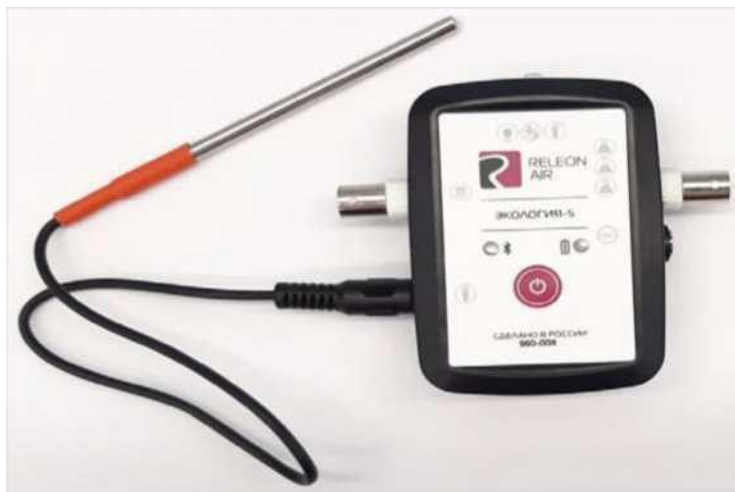
Рис. 6. Датчик температуры растворов

Датчик температуры термопарный предназначен для измерения температур до 900. Используется при выполнении работ, связанных с измерением температур плавления и разложения веществ, а также для измерения температуры в экзотермических процессах. Датчик звука — измеряет уровень шумов в окружающей среде и при оценке шумопоглощающих изоляторов. Динамический диапазон: от 30 до 130 дБ. Частотный диапазон: от 50 Гц до 8 кГц. Разрешение: 0,1 дБА (акустические децибелы). Техно-логические особенности: датчик чувствителен к резким звукам, которые могут дать завышенные результаты измерений.