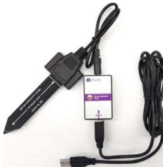
Рис. 4. Датчик влажности почвы Датчик электропроводности — предназначен для регистрации и измерения удельной электропроводности жидких сред, в том числе и водных растворов веществ. Применяется при изучении характеристик водных растворов, в том числе почвенных вытяжек.

Датчик влажности почвы — предназначен для измерения степени увлажнения почвы, выраженной в процентах. Применяется в агроэкологических и сельскохозяйственных исследованиях.