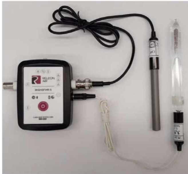
Рис. 10. Ионоселективный датчик (присоединены электрохлоридионов и электрод сравнения)

Датчик кислорода — предназначен для определения относительной концентрации кислорода в воздухе. Диапазон измерения: от 0 до 100 %. Разрешение: 0,1 %. Технологические особенности: при измерении содержания газа в выдыхаемом воздухе необходимо держать мембрану максимально близко ко рту; восстановление показаний на воздухе происходит через 1—2 минуты (время диффузии через мембрану).