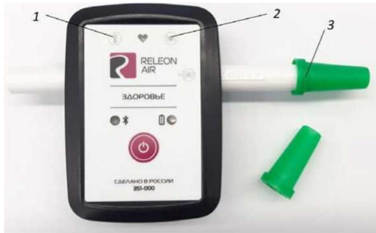
Рис. 3. Мультидатчик по физиологии. Обозначение разъемов и технологических отверстий: 1 — температура тела, 2 — пульс, 3 — частота дыхания (надет съёмный мундштук)