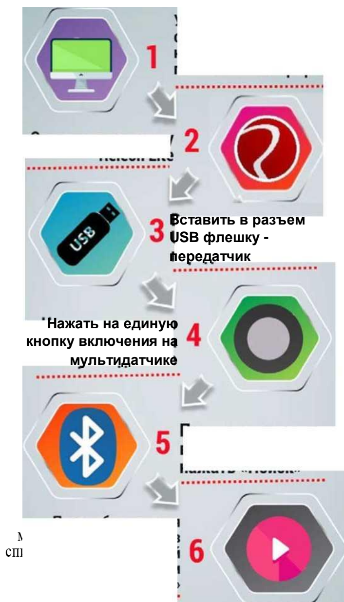
Рис. 14. Алгоритм работы с программным обеспечением Releon Lite

Установить программное обеспечение Releon Lite на ваш компьютер, планшет или смартфон Переключиться на вкладку Bluetooth и нажать «Поиск»