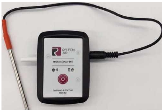
Рис. 12. Датчик температуры тела

Датчик артериального давления — позволяет измерять артериальное давление в диапазоне от 0 до 250 мм рт.ст. Разрешение датчика: 0,1 мм рт.ст. Датчик позволяет определить систолическое, диастолическое давление, пульс. В комплект датчика входит специальная манжета с утягивающим механизмом, нагнетатель воздуха с воздушным клапаном и трубка для подключения к датчику. Технологические особенности: необходимо контролировать плотность подключения разъемов, правильность положения манжеты на плече. Воздух из манжеты следует спускать равномерно, медленно, слегка приоткрыв клапан нагнетателя.