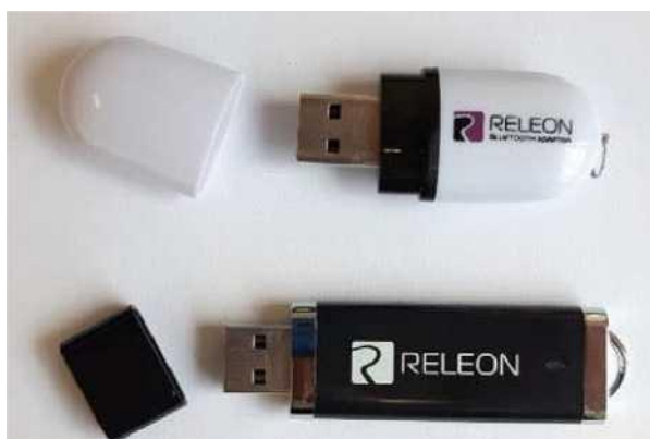
Рис. 13. Общий вид DSB-флеш-накопителя (внизу) и Bluetooth-адаптера (вверху) Releon

Установка ПО Releon Lite на регистратор данных с операционной системой Windows может осуществляться как с GSB-флеш-накопителя, так и с сайта производителя, установка на мобильные телефоны (смартфоны) — только с сайта производителя, ссылка на который приводится в списке источников информации пособия. В последнем случае доступна установка на устройства с платформами Android и iOS . Порядок установки ПО Releon Lite описан в руководстве, которое входит в комплект поставки. Алгоритм работы в программном обеспечении несложен. Графически он представлен на следующей схеме (рис. 14)