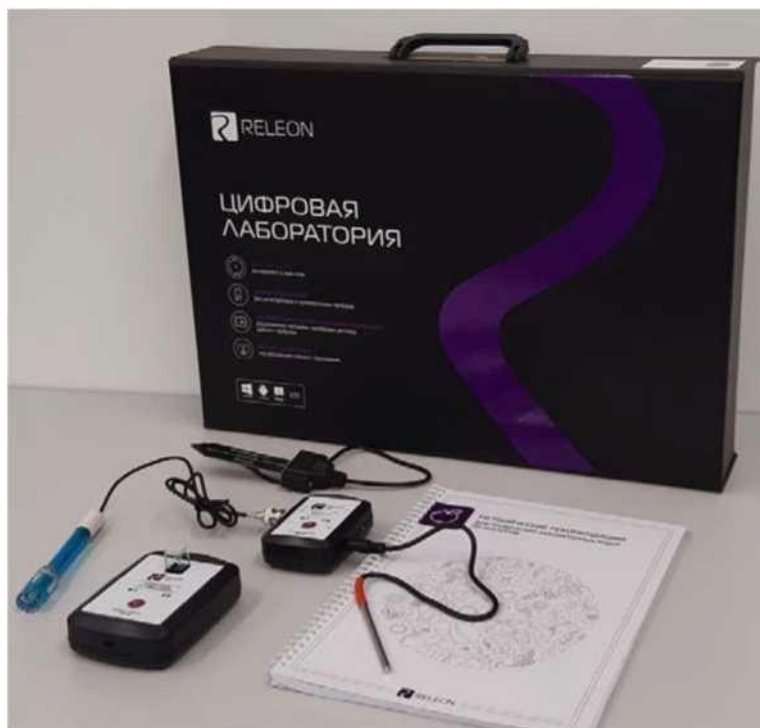
Рис. 1. Цифровая лаборатория

Ниже дана краткая характеристика цифровых датчиков, приведены выявленные на практике технологические особенности применения. Учёт этих особенностей позволит правильно использовать датчики и продлить срок их службы.