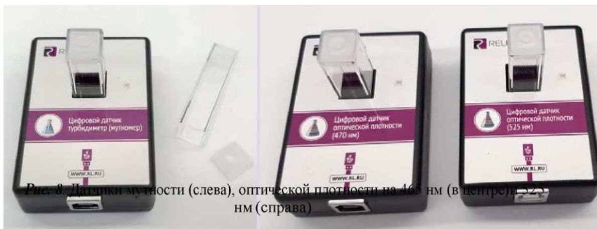
Рис. 8. Датчики мутности (слева), оптической плотности на 470 нм (в центре) и 525 нм (справа)

Датчик мутности (турбидиметр) — определяет мутность раствора в инфракрасном диапазоне света на основании измерения интенсивности светового потока рассеянного частицами, взвешенными в контролируемом растворе. Диапазон измерения: от 0 до 200 NTU ( Nephelometric Turbidity Units — нефелометрические единицы мутности). Разрешение: 1 NTU . Длина волны источника света: 940 нм. Технологические особенности: требуется хорошо промывать кювету для исследуемого раствора.