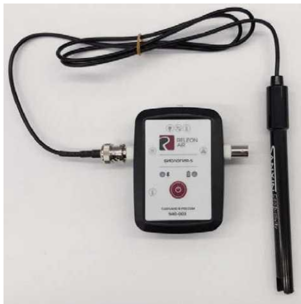
Рис. 5. Датчики электропроводимости

Датчик освещённости — измеряет уровень освещенности и обладает спектральной чувствительностью близкой к чувствительности человеческого глаза. Диапазон измерения: от 0 до 188 000 лк. Относительная погрешность: 15 %. Диапазон рабочих длин волн: от 350 до 780 нм. Технологические особенности: чувствителен к направлению на источник света.