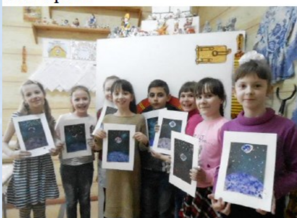
Учащиеся детского объединения «Избушка творчества»

своими руками различные поделки. Занимаясь в объединении, учащиеся получают дополнительный стимул к саморазвитию, вырабатывают уверенность в себе, лидерские и организаторские качества, тренируют силу воли.